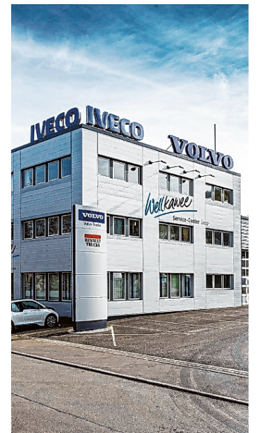
Das Service-Center von Wellkawe in Aalen

Aber auch, wenn es um die Reparatur und Service von privaten Wohnmobilen geht, ist Wellkawe gefragt. Zum Leistungsumfang gehören unter anderem die Reparatur von Nutzfahrzeugen aller Art, Busreparatur und -wartung, Klima-Service, fachmännische Serviceleistungen rund um Bremsen, Ladebordwand, Elektrik und Elektronik, Reifen, Hydraulik, Karosserie- und Aufbautechnik, gesetzliche Untersuchungen sowie Ersatzteile von A bis Z.